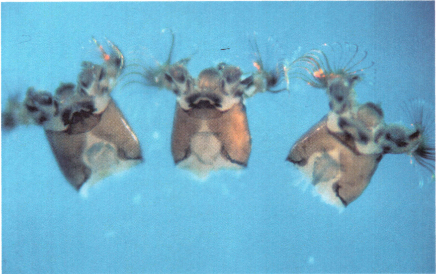
Abb. 3: S. degrangei . Variabilität in der Ausprägung des Ventralausschnitts (links typisch)