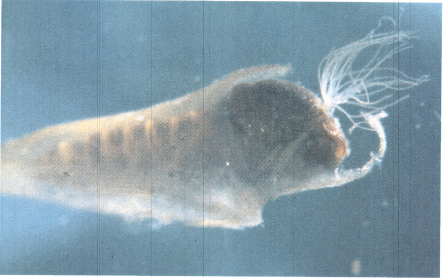
Abb. 4: S. degrangei . Puppe mit charakteristischem Kokon