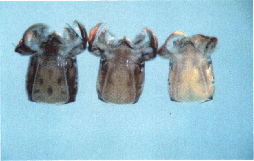
Abb. 2: S. degrangei . Variabilität der Zeichnung des Frontoclypeus (links typisch)